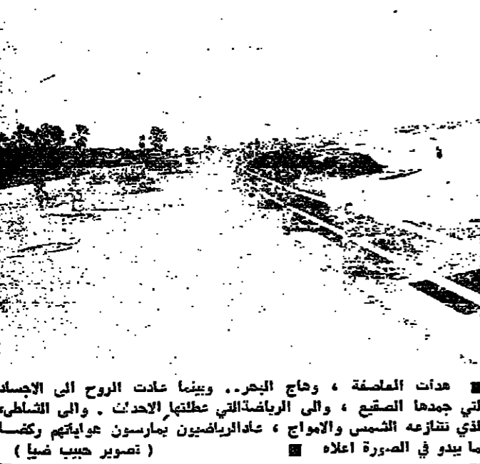
هدات العاصفة ، وحاج البحر . وبينما عادت الروح الى الاجساد التي جمدها الصقيع ، والى الرياض التي عطلتها الاحداث . والى السلطات التي تنازعه الشمس والأمواج ، عاد الرياضيون يمارسون هوايتهم وكما كما يبدو في الصورة اعلاه .